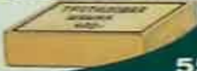
Шашка массой 400 г