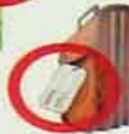
БЕСХОЗНЫЕ СУМКИ, ПОРТФЕЛИ, ПАКЕТЫ